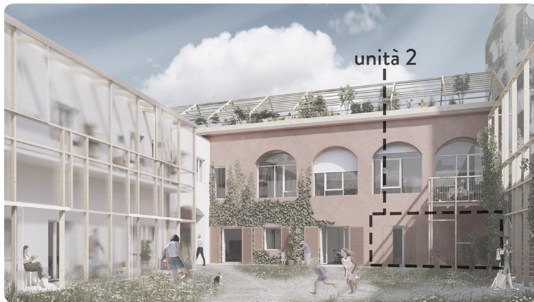
* le immagini presentate sono da intendersi a titolo puramente esemplificativo

Questo appartamento può contare su ampie vetrate esposte a sud con affaccio sulla corte.